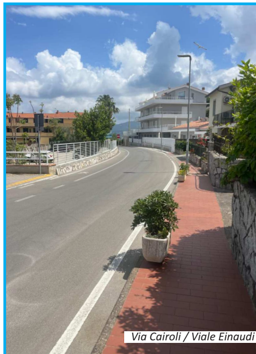
Via Cairoli / Viale Einaudi

Ci impegneremo dunque per co-organizzare, in rete con le altre amministrazioni, un servizio autobus di ritorno notturno da Portoferraio verso i paesi, così da consentire a tutti di trascorrere le proprie serate nel capoluogo. Inoltre il servizio deve adattarsi alle esigenze quotidiane, collegando (andata e ritorno) la città (e i suoi parcheggi) con i grandi eventi elbani e con le discoteche, per garantire mobilità economica e sicurezza stradale