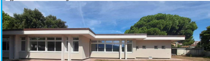
Efficientamento energetico e manutenzione straordinaria scuola media

Quindi, discipline umanistiche come beni culturali, discipline scientifiche quali ad esempio biologia marina o geologia ed infine discipline legate al settore agrario, turistico e marittimo.