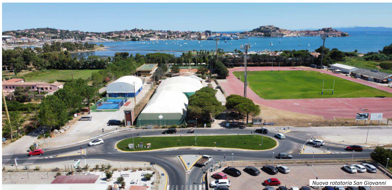
Nuova rotatoria San Giovanni