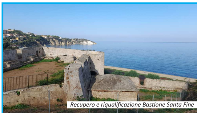
Recupero e riqualificazione Bastione Santa Fine